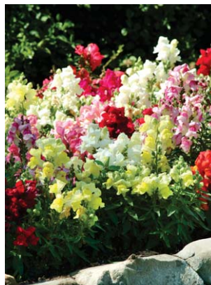
0910 Snapshot Mix F1

Tattoo – bezpochyby nejunikátnější vinca na současném trhu! Barevný kontrast na květech Tattoo je nejpatrnější za horkých dnů s větším množstvím světla – vysoké teploty a světlé barvy rozjasňují. Za chladnějších podmínek a při menším množství světla jsou barvy celkově tmavší a méně kontrastní. Pro odrůdy Tattoo se doporučuje vyšší teplota při klíčení, a to 24–26 °C po dobu 3–5 dní.