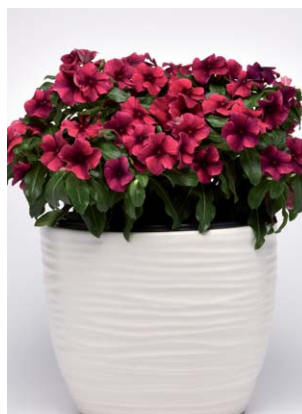
8170 Tattoo Black Cherry