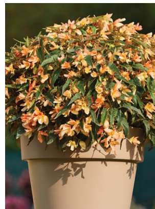
1440 Copacabana Tricolour F1