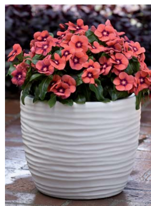
8200 Tattoo Tangerine