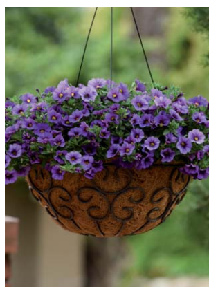
7430 Kabloom Denim