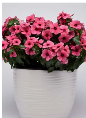
8190 Tattoo Raspberry