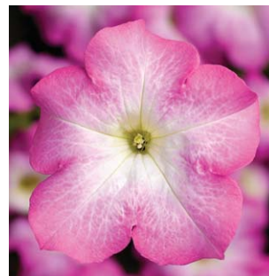
2330 Express Pink Morn F1