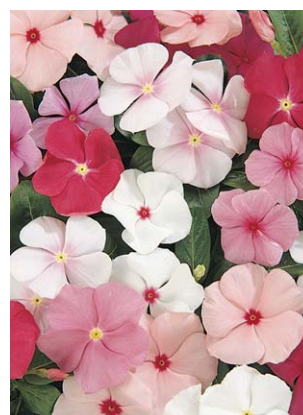
8500 Mediterranean Mix F1