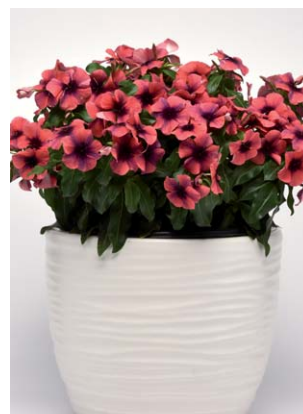
8180 Tattoo Black Papaya