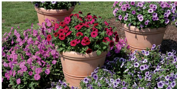
Směs drobnokvětých odrůd F1

2330 Express Pink Morn F1 , světle růžová s krémovým jícnem