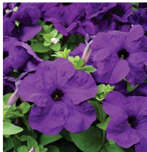
4230 Express Blue F1