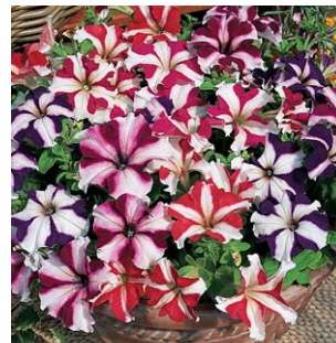
4280 Express Star Mixture F1