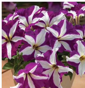
2320 Express Purple Star F1