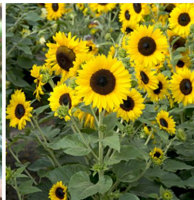
3340 Dancing Sun F1