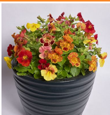
13470 Medius Mix F1

Velké kulovité květy Tagetes erecta jsou většinou spojovány se žlutými a oranžovými odstíny. Nyní si však výsadby nebo kytice řezaných květů můžete doplnit o čisté bílou barvu vysoce plnokvětě odrůdy 12580 WhiteGold Max . Odrůda 11780 Xochi™ Orange F1 se pak vyznačuje obřími oranžovými květy a pevnými stonky o délce 60 cm. Jedná se o jednu z nejlepších k řezu.