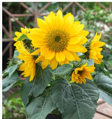
14020 Smiley Gold F1