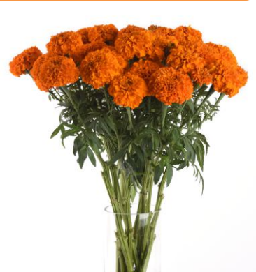
11780 Xochi™ Orange F1