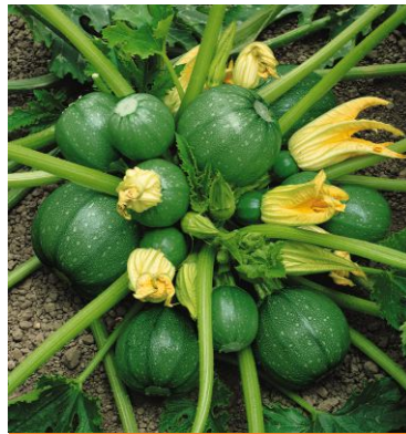
606260 Tondo di Piacenza

Helianthus annuus je všem známá a oblíbená květina. Není nutné ji představovat. Jen bychom chtěli připomenout několik odrůd, které v katalogu nemáme příliš dlouho, ale významně obohacují sortiment barvou, tvarem květů nebo výškou rostlin. Začneme nízkými novinkami pro výsadby do nádob, které nevytváří pyl. Žlutá s tmavým středem květů je 14010 Smiley F1 , 14020 Smiley Gold F1 má žluté lístky i žlutý střed květu. 3340 Dancing Sun F1 doplňuje skupinu bez pylu o rozvětvené rostliny, vysoké okolo 1 m, které lze využít pro řez i do velkých nádob. Z netradičně zbarvených odrůd pro řez květů jsme pak vybrali 6460 Claret F1 s tmavě vínově červenými květy a 12900 Red Sun , která kvete v červených odstínech. Velmi neobvyklá je vysoká plnokvětost, vyskytující se u odrůdy 13730 Tall Lemon Sungold , jejíž světle žluté květy dosahují průměru 18–20 cm.