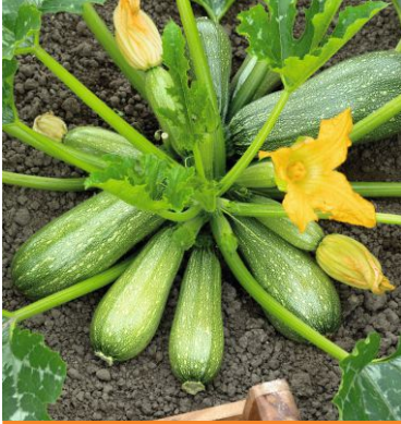
606220 Bianca di Trieste