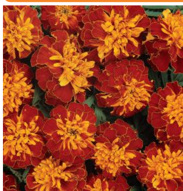
3830 Bonanza™ Harmony