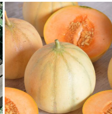
620810 Cantalupo di Charentais