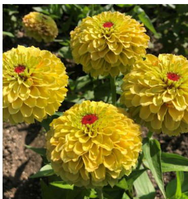
14200 Queeny Lemon Peach