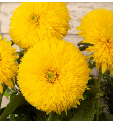
13730 Tall Lemon Sungold