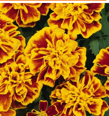
3840 Bonanza™ Bee