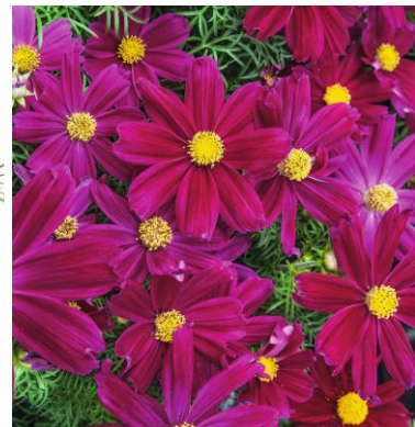
11660 Casanova Violet