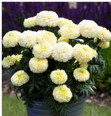
12580 WhiteGold Max