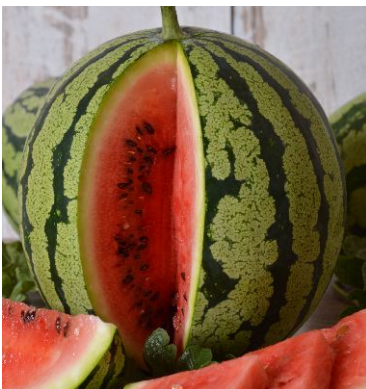
621040 Moro F1