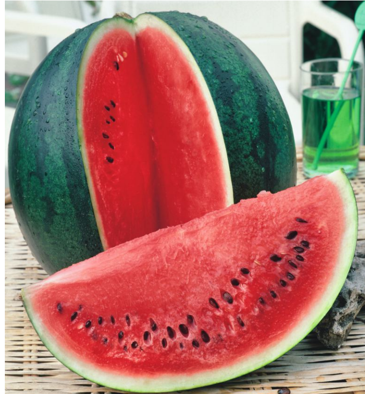
621010 Lajko II F1

V posledních letech vzrůstá zájem o melouny cukrové ( Cucumis melo ), které jsme zařadili na podzim do sortimentu ve dvou variantách. 620810 Cantalupo di Charentais s kulatými plody a žlutooranžovou dužninou má sladkou a aromatickou chuť. 620820 Junior F1 se vyznačuje vejčitými plody, velkou raností a hustou oranžovou dužninou.