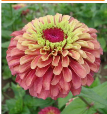
14220 Queeny Lime Red