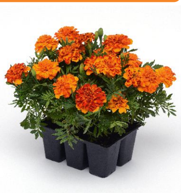
3810 Bonanza™ Bolero