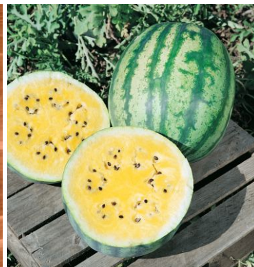
621020 Primagold F1