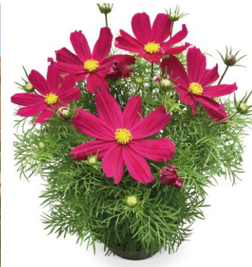
11650 Casanova Red