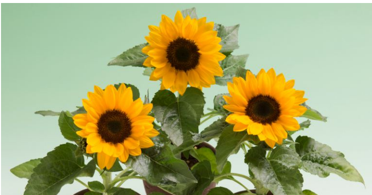
14010 Smiley F1