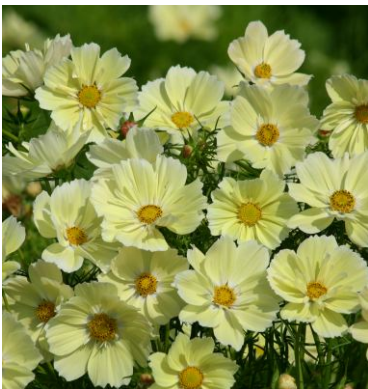
8930 Xanthos FSN-FSG