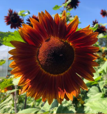
6460 Claret F1