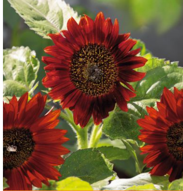
12900 Red Sun