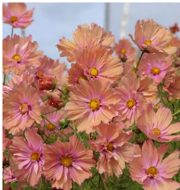
7660 Apricotta FSN