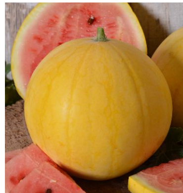
621050 Zloto Wolicy F1