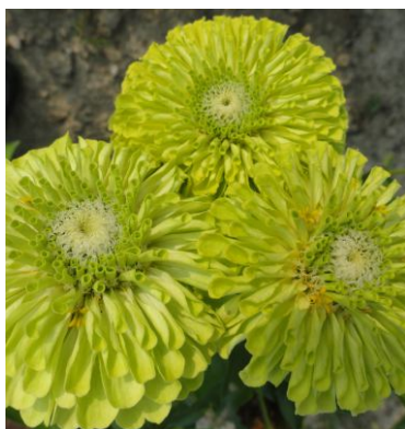
14210 Queeny Lime