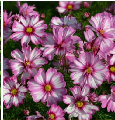
8880 Capriola FSN