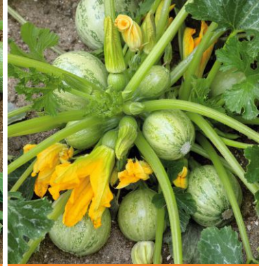
606270 Tondo Chiaro di Nizza