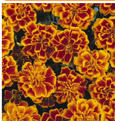
3820 Bonanza™ Flame