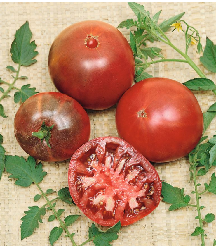
632430 Noire de Crimée

Sadba rajčat ( Lycopersicon esculentum ) je stále velmi oblíbená. Do popředí se v posledních letech dostávají odrůdy s drobnými plody různých barev a tvarů. Rádi bychom připomněli barevně netradiční odrůdy 632420 Yellowstone s velkými masitými žlutými plody, 632430 Noire de Crimée s tmavě hnědými plody a 632410 Blackball s dlouhými vijany menších černých plodů. Ze skupiny koktejlových rajčat bychom rádi vyzdvihli zejména 632220 Delikano F1 s červenými podlouhlými plody, 632230 Odat F1 s oranžovými datlovými plody, 632160 Radana s malými červenými plody hruškovitého tvaru a 632170 Taiko s drobnými žlutými protáhlými plody na rozvětvených vijanech.