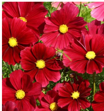
8910 Rubenza FSN