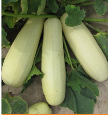
606230 Greta F1