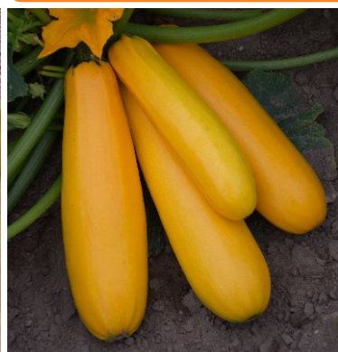
606210 Atena Polka F1