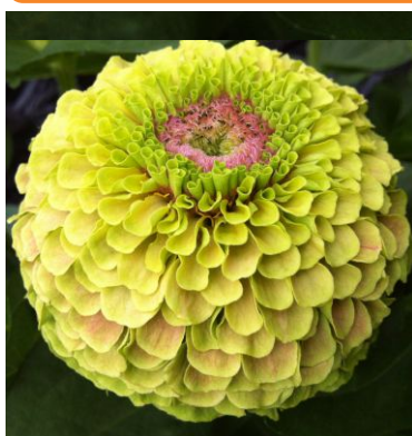
14230 Queeny Lime with Blotch