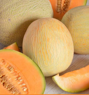
620820 Junior F1