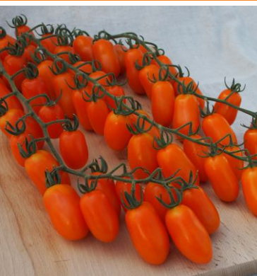
632230 Odat F1

Tykev - cuketa ( Cucurbita pepo ) se pěstuje nejčastěji s tmavě zelenými plody. V naší nabídce si však můžete vybrat z celé řady barev a tvarů, které zcela jistě zaujmou i vaše zákazníky. Odrůda 606210 Atena Polka F1 se vyznačuje tmavě žlutými kyjovitými plody na bujně rostoucích keříčkovitých rostlinách. 606220 Bianca di Trieste má světle zelené plody válcovitého tvaru a je velmi raná. 606230 Greta F1 je ceněna především pro chuťové vlastnosti a velmi světle zelenou až bílou barvu. 606240 Grey je velmi raná, určená pro sklizeň mladých plodů od délky 12 cm v bledě mátově zelené barvě s šedými skvrnami. 606250 Romanesco má bujný růst a bohatou násadu výrazně žebrovaných plodů s výraznými světle zelenými pruhy. Tato odrůda se často využívá pro sklizeň jedlých květů. Pro kulaté plody se pak pěstují odrůdy 606270 Tondo Chiaro di Nizza a 606260 Tondo di Piacenza .