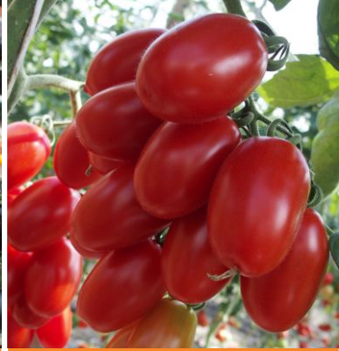
632220 Delikano F1